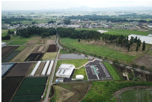
(写真) 国史跡 摩利支天塚・琵琶塚古墳と古墳資料館