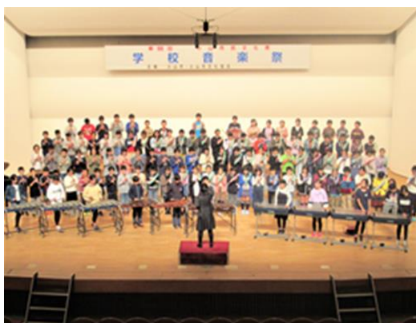
(写真) 小山市民文化祭での学校音楽祭