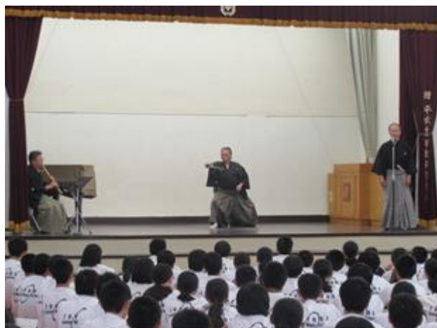
(写真) 市内中学校での 伝統文化ふれあい教室