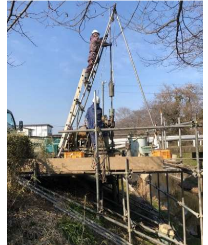
大行寺橋のボーリング調査の様子

大行寺橋は、橋の橋台部分の設計に必要な現地の地質条件を把握するためのボーリング調査（深さ約30m、2箇所）を行っています。また、大行寺橋周辺では、橋への取付け道路設計を行うための測量を行っています。