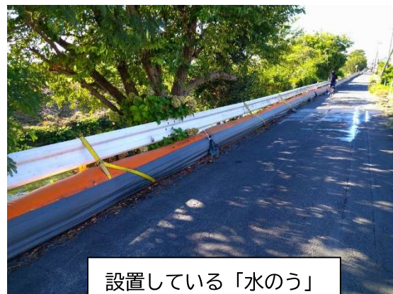
設置している「水のう」

豊穂川周辺にお住いの方々の避難時間確保や浸水被害の軽減を目的とする「緊急排水強化対策」の一環として設置した「水のう」について、令和4年度の出水期が終わったことから市街化区域内の「水のう」は撤去を行います。作業に関しては、近隣の皆様のご理解とご協力をお願いいたします。