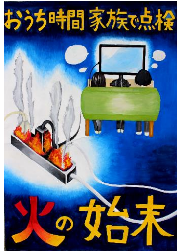
【生徒の部受賞作品】