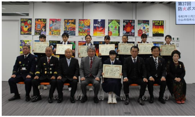
【生徒の部受賞者の皆さん】

女性防火クラブ員募集 小山市女性防火クラブ連合会では、防火・防災にご協力いただける女性の方及び女性グループを募集し、クラブの設立を推進していきます。 ご連絡は、女性防火クラブ連合会事務局へ