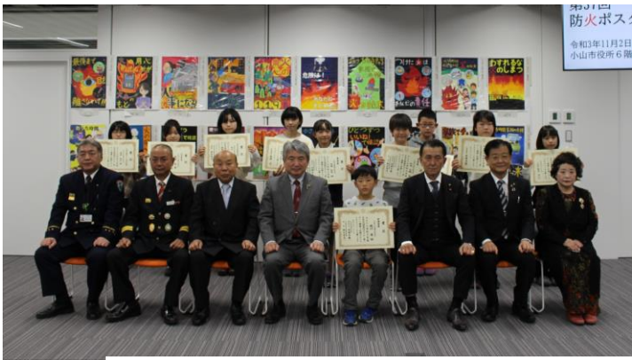
【児童の部受賞の皆さん】