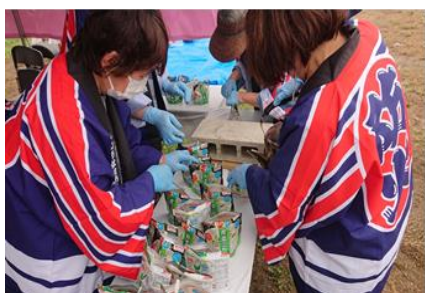
【炊き出し訓練アルファ米 約200食作成】