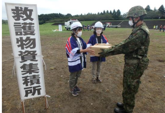
【救援物資引渡し訓練】

令和4年9月3日(土)「令和4年度小山市水防訓練」が石ノ上河川広場で開催され、女性防火クラブ連合会も参加し、炊き出し訓練及び陸上自衛隊との救護物資引渡し訓練を実施しました。炊き出し訓練ではクラブ員の皆さんがアルファ米約200食分の炊き出しを行いました。 女性防火クラブの皆様、ご協力ありがとうございました。