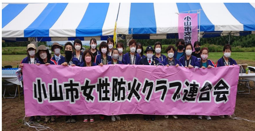
【小山市女性防火クラブ連合会の皆様】