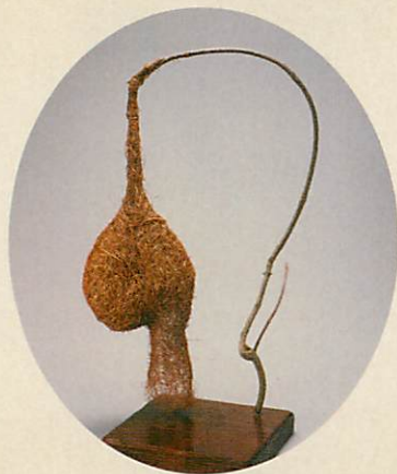
キムネコウヨウジャクの巣

日本や世界各地をたずねて集めた鳥の巣は、なんと400種類、2,000個以上。鳥の巣の図鑑や絵本を何冊も出版しています。この展覧会では大小さまざまな世界の鳥の巣約30点と、絵本の原画約80点をご紹介します。身近な自然がますます好きになる、ユニークな展覧会をお楽しみください。