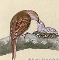
セミサンショウクイ