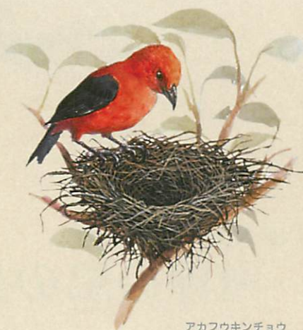
アカフウキンチョウ