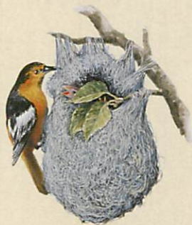
ボルチモアムドリモドキ

開館時間：午前9時～午後5時(入館は午後4時30分まで) 休館日：月曜日、(7/18は開館)、7/19(火)、22(金)、8/12(金)、26(金) 観覧料：一般400(団体300)円、大高生250(団体150)円、中学生・義務教育学校生以下無料 *団体は20名以上 *障がい者手帳をお持ちの方と付添一名無料 *おやまミュージアム割引! 小山市立博物館企画展の半券 (2022年4月以降の日付印があるもの。年度内、1回限り有効)で一般100円、大高生50円を割引(ほかの割引との併用不可) 後援：朝日新聞宇都宮総局、FMおーらじ、エフエム栃木、産経新聞社宇都宮支局、下野新聞社、テレビ小山放送、東京新聞宇都宮支局、とちぎテレビ、栃木放送、毎日新聞宇都宮支局、読売新聞宇都宮支局