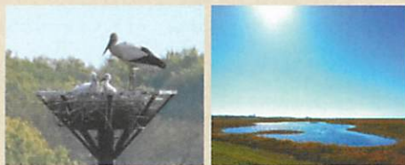
人工巣塔でのコウノトリ親子 渡良瀬遊水地