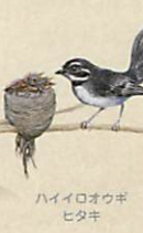
ハイイロオウギ ヒタキ