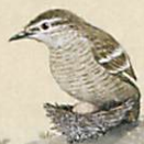
マミジロナキ サンショウクイ