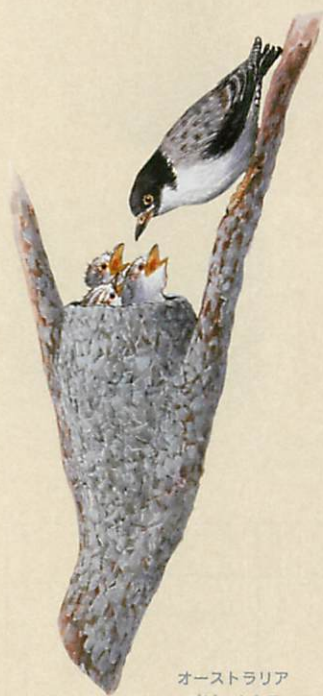
オーストラリア ゴジュウカラ