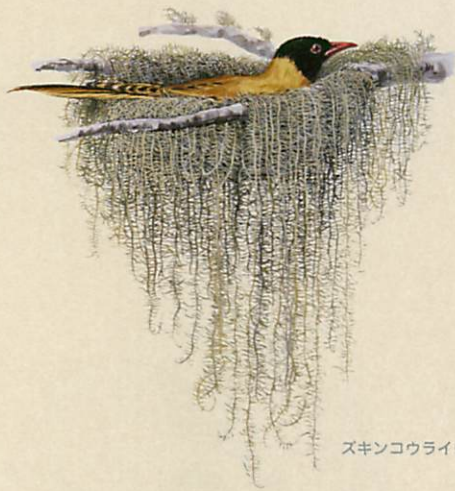
ズキンコウライウグイス