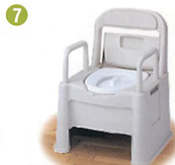
品名: ポータブルトイレ座楽 背もたれ型HD 品番: SPTH