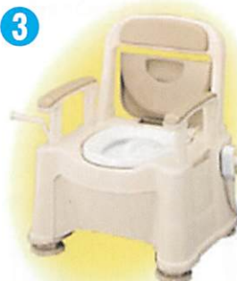
品名: ポータブルトイレ座楽 SP あたたか 品番: APTSP