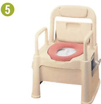
品名: ポータブルトイレ座楽 背もたれ型 品番: SPTSD