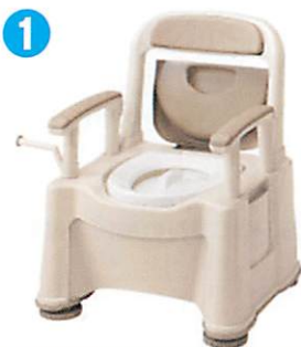
品名: ポータブルトイレ座楽 背もたれ型SP 品番: SPTSP