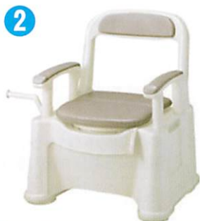
品名: ポータブルトイレ座楽背もたれ型 SPソフト便座・便フタタイプ 品番: SPTSPS