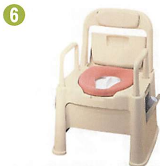
品名: ポータブルトイレ座楽 背もたれ型SB 品番: SPTSB