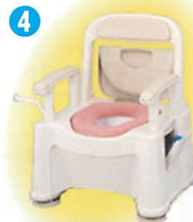
品名: ポータブルトイレ座楽背もたれ型 SP小口径便座タイプ 品番: SPTSPMB