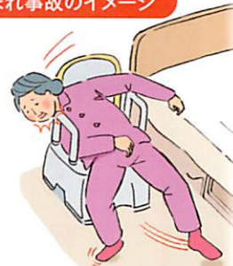
はさまれ事故のイメージ

ご使用中のお客様には大変ご迷惑をおかけいたしますことを深くお詫び申し上げます。何卒ご理解とご協力をお願い申し上げます。