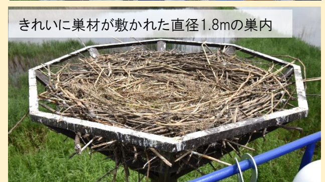
きれいに巣材が敷かれた直径1.8mの巢内