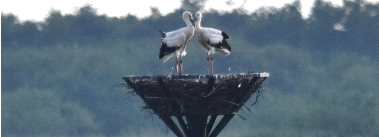
令和2(2020)年7月19日 誕生後51日目目のヒナ ～小山市の渡良瀬遊水地第2調節池内人工巣塔にて～

昭和46(1971)年に国内野生コウノトリが絶滅して以降、東日本初となる野外繁殖により「ひかる」・「歌」ペアから誕生したヒナです。命名する愛称は、小山市内外より1,000件を超えるご応募の中から選定を行い、オス、メスともに応募数が最も多かった「わたる」(オス)と「ゆう」(メス)に決定しました。