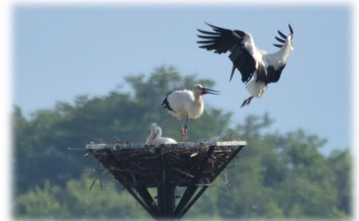
交代で子育てに励む「ひかる」・「歌」