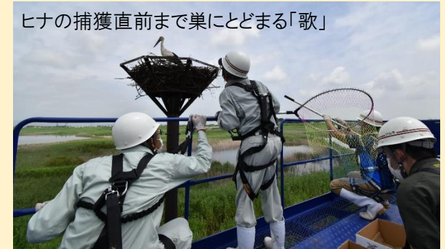
ヒナの捕獲直前まで巣にとどまる「歌」

尚、渡良瀬遊水地第2調節池堤防上の仮設観察小屋やコウノトリの情報掲示板は、潮田建設株式会社様にご協力いただき設置していただきました。