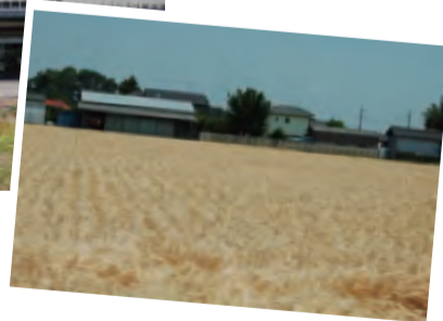
金色の麦畑（おーバス車窓から）