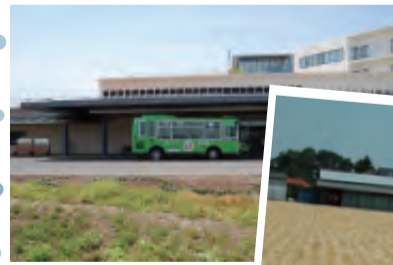
はたらくおーバス