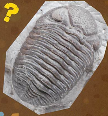
栃木県立博物館蔵