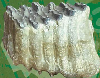
ナウマンゾウの歯 小山産 (当館蔵)