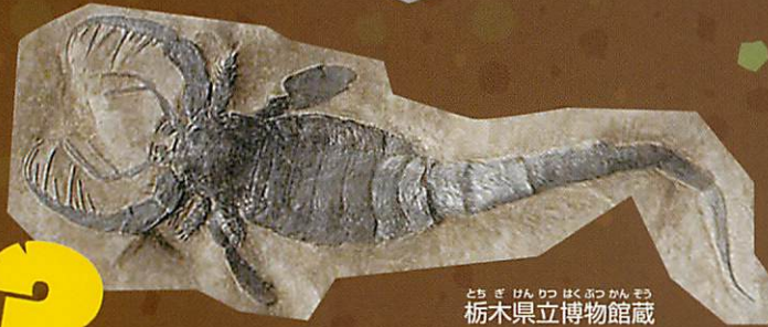
栃木県立博物館蔵