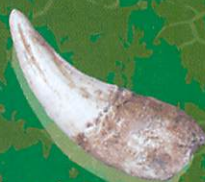
ヒョウ (栃木県立博物館蔵)