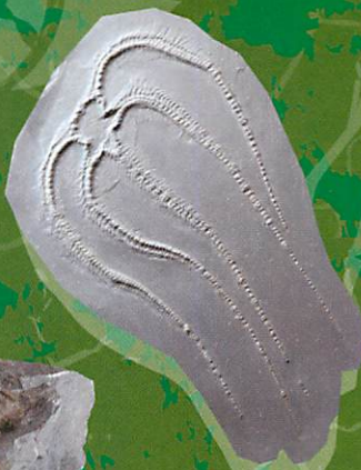
クモヒトデ (栃木県立博物館蔵)