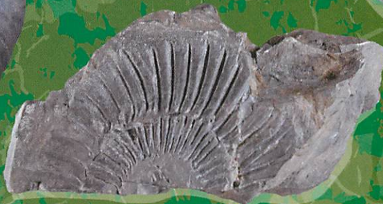
栃木産アンモナイト (栃木県立博物館蔵)