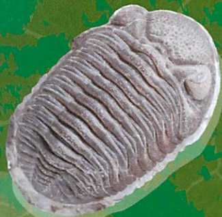
三葉虫 (栃木県立博物館蔵)