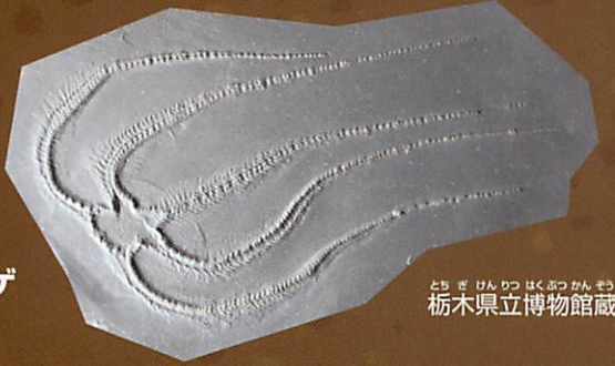
栃木県立博物館蔵