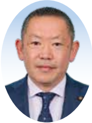
小川 亘 議員