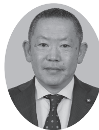
小川 亘 議員