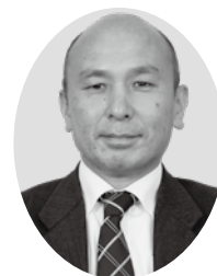
平野 正敏 議員

※ かけはし…来日直後等の事情により、日本語の習得が十分でない子どもたちにも、日本語の初期指導や生活適応指導を行う教室。平成20年に小山市城東小学校敷地内別棟に設置された。