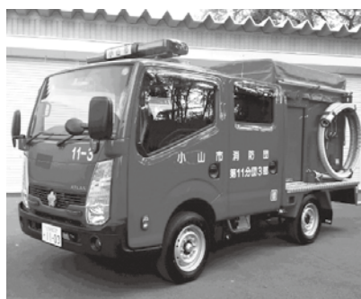
導入予定の小型動力消防ポンプ付積載車（同型車）

答 現行の車両は、平成13年9月および平成14年1月に取得したもので、経過年数はいずれも22年です。また、取得する車両の耐用年数は、メーカーから15年が目安であると示されています。小山市消防本部としては、消防団車両については、概ね20年を目安とした更新を計画しています。