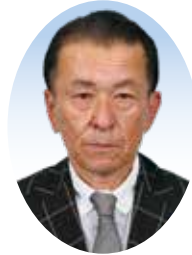
福田 洋一 議員