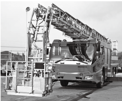
導入予定の災害対応特殊はしご付消防自動車（同型車）

購入方法…指名競争入札 購入金額…2億2528万円 購入先…（株）モリタ東京支店 納期…令和6年3月18日