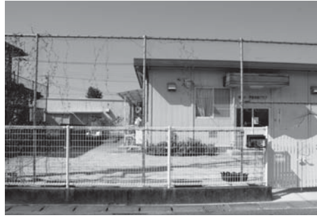
環境の見直しが求められている学童保育館

● あなたも「議会だより」に写真を投稿してみませんか。 ● 写真は「議会だより」の発行月（1月・2月・5月・8月・11月）に合わせた小山市内の季節感のあるものを募集しています。 ● あて先／小山市中央町1丁目1番1号 小山市議会事務局 ● 問い合わせ先：議会事務局（☎22-9463）までお気軽に！