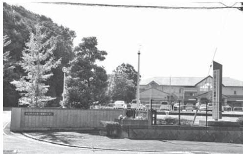
指定管理者制度が導入されている「いきいきふれあいセンター」

副市長 電気事業法の改正により電力小売事業が自由化され、特定規模電気事業者P **4 Sの新規導入が可能となったことから、電力供給を複数の業者から選択できるようにな