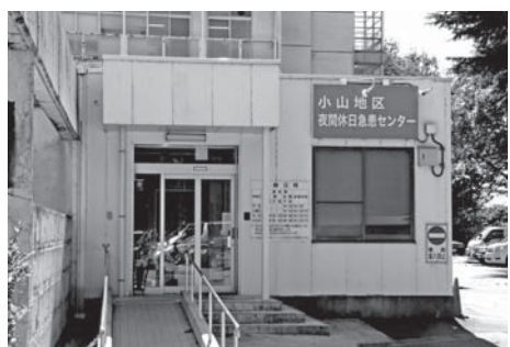
充実が求められる夜間休日急患センター

保健福祉部長 小山市の緊急医療は、小山地区救急医療対策協議会において協議し、初期救急、2次救急、3次救急の役割を分担しながら対応し