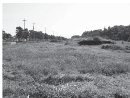
消防庁舎建設予定地（神鳥谷地内）

市長 懸案であった用地取得について、8月に地権者の合意が得られ、売買契約を締結することができたため、現況測量、外構実設計を早急に発注します。防災拠点施設としての消防庁舎の開庁は、小