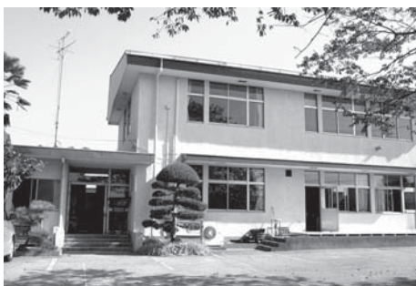
アルカディアの新築を

建設水道部長 小山市では、小山市総合都市交通計画に基づき都市基盤の充実や工業開発等の土地利用を十分に考慮した上で、計画的、効率的な道路整備を推進しています。整備の度合いは、地域特性によって異なりますが、地域に密着する一般道路や狭隘道路については、安全性や緊急性を考慮し、逐次整備することにより生活環境の整備を図っており、今後地域との連絡を密にし進めていきます。