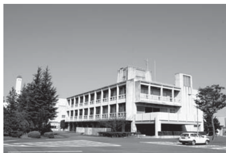
下水道汚泥保管場所の候補地「小山水処理センター」

建設水道部長 県が外城の2自治会に対し、説明会を開催しましたが、安全性確保への不安などの意見があり、搬入に対する理解が得られませんでした。県が示した保管方法については、小山水処理センターで壁厚20cmの鉄筋コンクリートの建屋内に保管し、スラグを大型ビニール製の袋に入れ、遮水シートで覆い管理