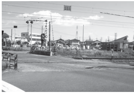
拡幅が望まれる両毛線踏切（県道喜沢一栗宮線）

総務部長 文書館では文書等収集基準を作成し、公文書や古文書のほか地域刊行物や文字で表せない当時の様子を伝える重要な歴史資料である写真などの映像記録も収集しています。したがって、一般の方から歴史的に貴重な写真等の寄贈があった場合には、それらを受け入れ、保存・管理