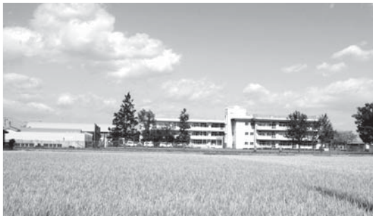
児童数が減少している豊田北小学校