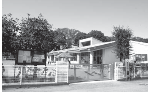
保育士の確保が望まれる (写真は絹保育所)

が学ばれているが、地域や学校によって差があり、最低でも1×1〜20×20、最高では1×1〜99×99までで、インドの影響を受け、中国や韓国でも2桁の九九はブームとなった。