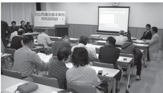
議会基本条例市民説明会の様子（間々田市民交流センター）