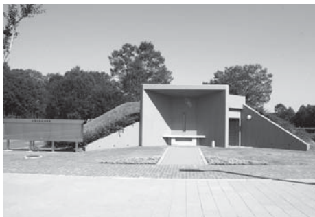
墓園やすらぎの森にある合葬式墓地

も中央図書館の司書や学校図書館支援ボランティア等の協力を得て、組織的な学校図書館運営に努め、魅力ある図書館づくりを進めていきます。