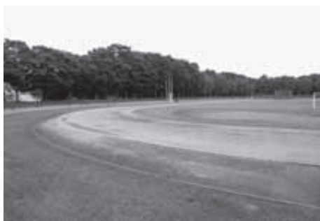
小山運動公園陸上競技場