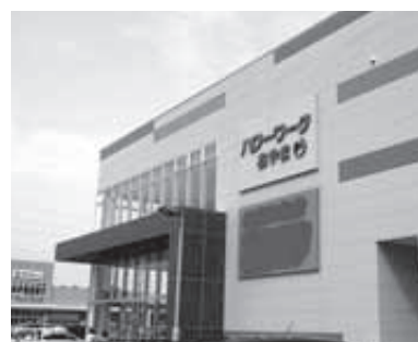
ハーヴェストウォーク内に移転したハローワーク

新設などをJR東日本に負担いただく内容で基本協定を締結し詳細設計を進めてきました。