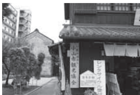
小山市観光協会（まちの駅内）

入時の適正な競争環境の創出、円滑な相互接続・連携システムの構築などをテーマとして、システムの最適化に向けたシステム全体の見直しを研究、検討しています。