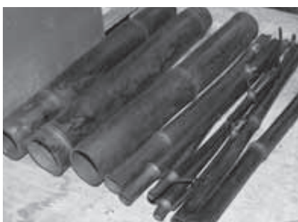
市内企業で製造された竹炭

ルスの侵入を阻止するための対策を実施してきました。さらに、県との連携強化や予防対策費の予算計上等を要望するとともに、風評被害を出さないこと、予防対策への協力のため、口蹄疫について市民にPRしています。