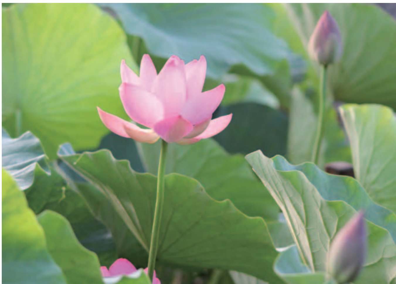
朝日に輝く古代ハス（大字高椅）