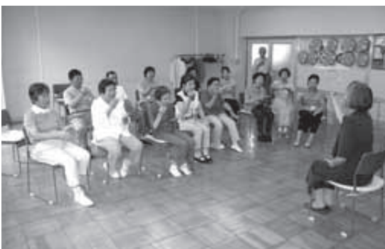
高齢者を対象にした手話講座

ため、小山氏や小山評定、甲冑展示などをテーマとした（仮称）小山市歴史資料館の設置計画を推進しています。