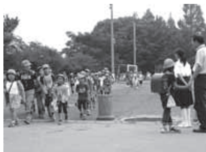
元気に登校する児童

ることから、今後は本会議や議員全員協議会などの場で報告するよう改善していきます。