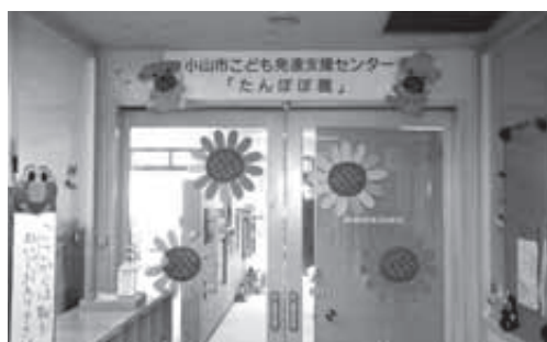
子ども発達支援センター「たんぼぼ園」