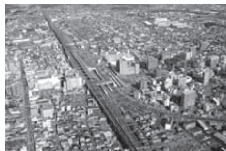
今後も人口増が期待される小山市

治区の事務所」と「地域協議会」で構成される。市町村を一定の区域に分けて、その区域を単位として、住民に身近な事務の処理に住民の意思を十分に反映させ、行政と住民が相互に連携することを目的としている。