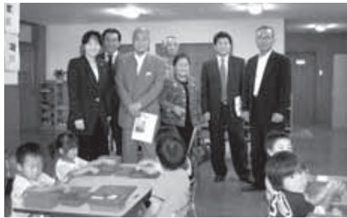
小山西保育園を現地調査する民生消防常任委員

れるのは、従業員確保への協力や、物流を考慮した交通アクセスの改良、さらに企業への報奨金などの優遇措置です。それらの内容については、企業誘致のため、自治体間で競争となつていきます。