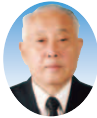
石渡 丈夫 議員