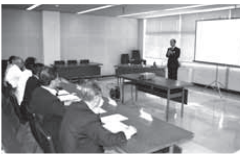
口蹄疫について県南家畜保健衛生所長から説明を受ける

答 今回の条例改正は、10ha以上の土地を取得する企業に対して奨励金と土地取得助成金の制度を拡充するものです。今回の改正により、北関東屈指の制度になると考えています。尚、県においても、土地の企業立地・集積促進補助金があり、該当する場合は、さらにその助成も受けることができます。