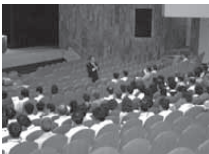
職員を対象に開催されたメンタルヘルス研修会

市長 基本構想は本年12月までに策定予定ですが、その内容としては基本理念・基本方針、診療科目、病床規模、運営形態などです。財政計画としては、整備費の大幅な縮減を図り、市債残高は建設に伴