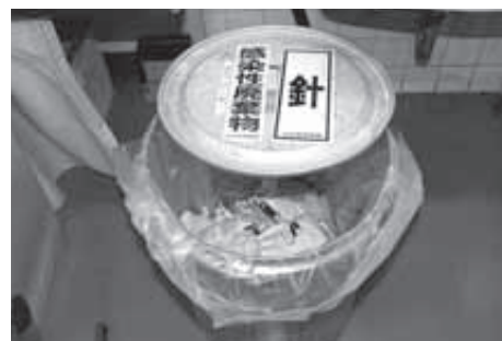
医療廃棄物（市民病院内）