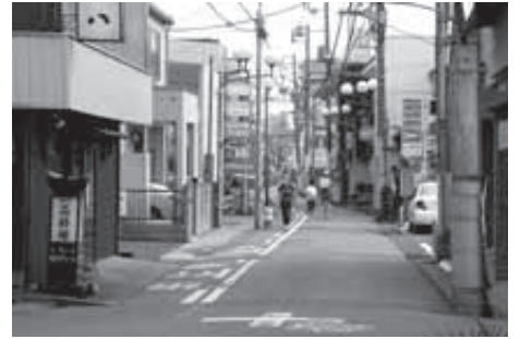
整備が待たれる三夜通り

企画財政部長 市民病院の4つの理念にあります①患者中心の医療②安全で質の高い医療③地域のための病院④密接な地域医療連携に基づき、市民とともに歩み、愛され、信