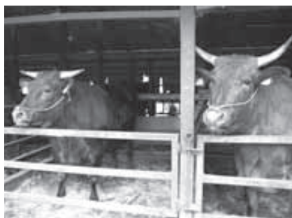
口蹄疫の万全な対策が期待される

ることから、今後は本会議や議員全員協議会などの場で報告するよう改善していきます。