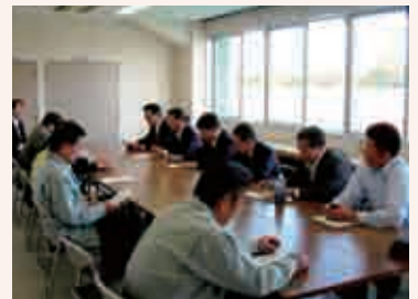
鈴鹿市を視察する建設水道常任委員

2007年に施行された「公認陸上競技及び長距離競争路、並びに競歩路規定」により、それまでの第3種競技場から第4種競技場に降格になってしまうことなどから、第3種競技場の公認を受けるために、全天候舗装を中心とした改修を行うことになり、8コースのトラック全天候舗装、走り幅跳び走路の全天候舗装、本部席前の全天候舗装、電子時計システムの構築、スタンドの整備、収納器具倉庫の増設などを行った。