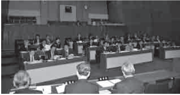
平成 21 年の市議会傍聴の記録 (人)

本会議場の傍聴席は34席あり、簡単な手続きで、どなたでも会議の様子を傍聴することができます。また、常任委員会（傍聴席10席）の審査の様子も傍聴することができます。議会と執行部の活発な議論の様子をぜひご覧ください。