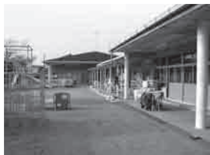
市立もみじ保育所