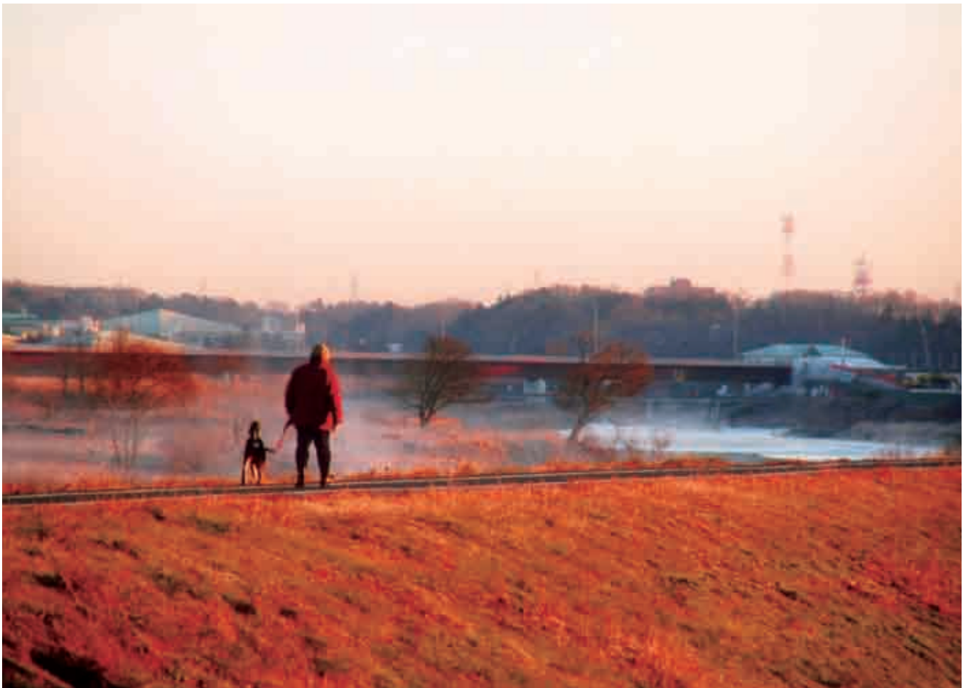
朝焼けの思川河川敷（大字間々田）