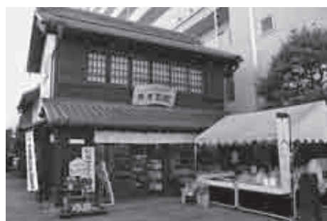
商工会議所が指定管理者になっているまちの駅