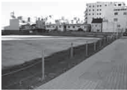
城山町3丁目のマンション建設予定地

問 公有地利用のマンション建設について、計画の大幅変更、次の再開発計画未確定、市税大幅減収等の状況下では凍結すべきだが。 企画財政部長 城山町三丁目第一地区の全体事業費は現在検討中であり、平成22年度についても未定です。