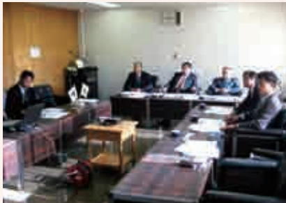
千歳市を視察する総務常任委員

多くの自衛隊施設がある千歳市には装甲車の通行可能な特殊道路(C経路)があり、この経路沿線の活性化のため防衛局の補助を得ながら大規模な防災学習交流施設を建設している。この施設は、訓練等に使用していないときは、広場は運動施設として、防災学習センターは会議室として地域の人を使用できるなど、地域に解放される。