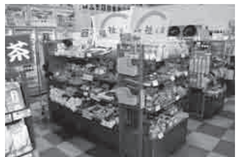
道の駅思川の福祉コーナー

す。また、高齢者の方々が、徒歩や自転車でも行ける最も身近な場所である各地域の自治会、公民館等をさらに有効活用してもらうことが、今後の地域づくりに必要であると考えています。