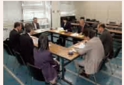
大阪市を視察する民生消防常任委員

大阪市西淀川区で起きた児童虐待死事件をきっかけに、大阪市中央児童相談所が児童虐待専用電話「児童虐待ホットライン」を開設したもので、24時間365日体制で児童虐待の通告や相談に対応している。フリーダイヤルで市民等からの通告 ・相談を受理し、虐待対策の迅速な対応につながるもので、非常勤嘱託職員7名(ローテーション勤務)が専任相談員として対応している。