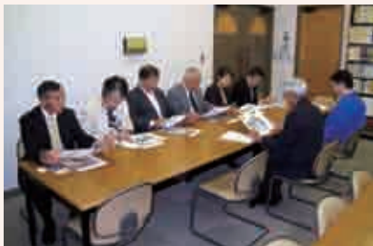
宮崎市を視察する教育経済常任委員

宮崎市の市制60周年記念事業の一つとして整備された蓮ヶ池史跡公園内に鉄筋コンクリート2階建て、延べ床面積2204.6㎡として、平成4年に開館。宮崎圏域の歴史・民族・文化に関する資料の収集、保存、展示を行っている。開館当初から、財団法人宮崎文化振興協会が市の委託を受け運営し、現在も指定管理者として財団法人宮崎文化振興協会が運営している。