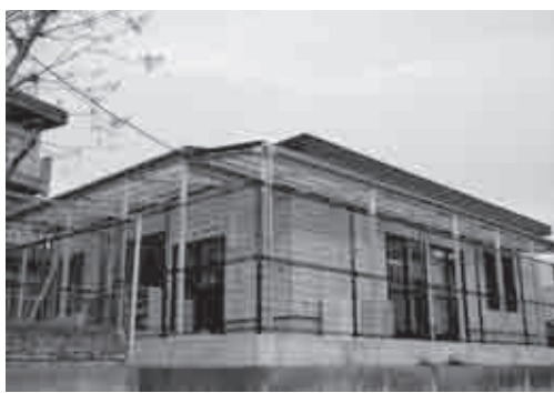
大谷北小第二学童保育館

利活動法人アデット） ②小山市城北児童センター（特定非営利活動法人ハートフル希望館） ③小山運動公園、あけぼの公園、原之内公園、思川緑地、小山総合公園（財団法人小山市まちづくり協会）。