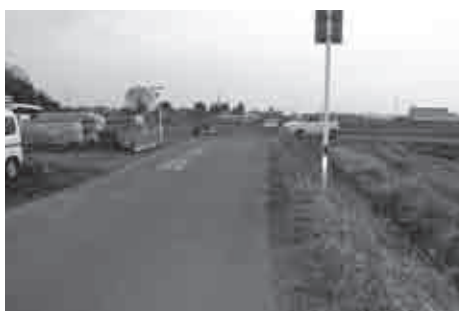
クランクになっている市道33号線

病院に負けない高い水準の医 療を提供するとともに、すべ ての職員が心の底から患者さ んのために尽くす医療人であ ってほしいと思います。そし て健全な経営状態にするべく 方策を模索したいと思えます。