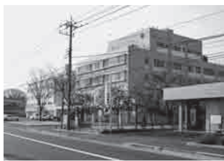
救急当番病院となっている光南病院

設置については、今年度の予算を見直しながら、場合によっては来年度予算計上するよう早急に検討します。