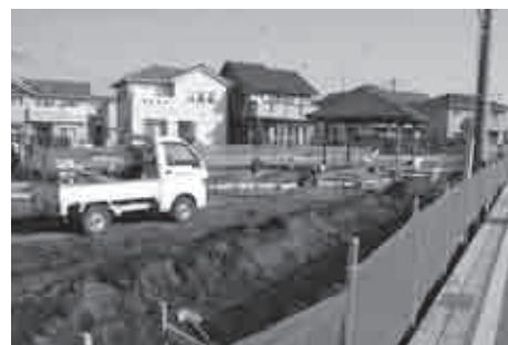
健康器具設置を予定している公園建設地

「わたしの市民便利帳」の改訂に併せ、補助金一覧表を掲載できるようにしていきます。