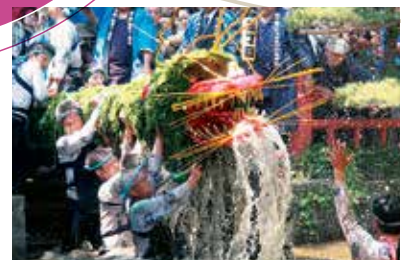
間々田のじゃがまいた