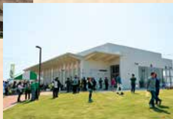
摩利支天塚・琵琶塚古墳資料館

2つの古墳が寄り添うように築かれており、両古墳とも墳長約120m規模の栃木県最大級の前方後円墳です。2018年、古墳の隣に、両古墳の歴史や出土した埴輪・装飾品等を展示説明する「摩利支天塚・琵琶塚古墳資料館」がオープンしました。