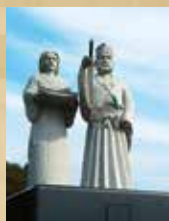
小山市開祖 「政光公と寒川尼像」

寿永2(1183)年、頼朝に立ちはだかった常陸国(茨城県)の志田義広(頼朝の叔父)を政光の子朝政が野木宮で迎え撃ち、これを敗走させました。この戦いは、関東に残る反頼朝勢力を消滅させ、頼朝は関東の地盤を磐石にし、勇躍西上し、平家打倒に向かわせる節目となった重要な一戦でした。それはまさに、鎌倉幕府成立の栄光に道筋をつけた、「開運」の戦であったのです。寒川尼は文治3(1187)年、頼朝から「大功」ありと賞され、女性ではめずらしい地頭に任命されています。