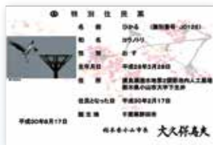
コウノトリ「ひかる」くんの特別住民票