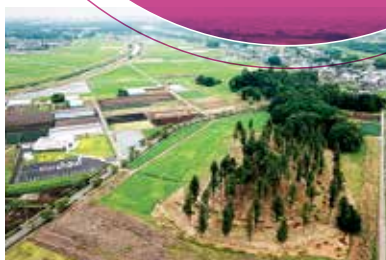
摩利支天塚古墳・琵琶塚古墳

の重要無形文化財に指定され、2010年にユネスコ無形文化遺産に登録された本場結城紬をはじめ、2019年、国の重要無形民俗文化財に指定された「間々田のじゃがまいた」、その他にも国指定の史跡を7つも有する小山市。人から人へ受け継がれてきた文化と歴史は、小山市の宝です。