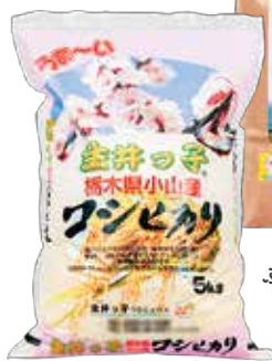
ラムサール ふゆみずたんぼ米