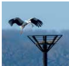
コウノトリ「ひかる」くん

目 本最大の遊水地であり、首都圏の治水の要でもある渡良瀬遊水地は、絶滅危惧種183種が生息・生育する「自然の宝庫」であり、2012年7月にラムサール条約に湿地登録されました。2018年からはコウノトリの長期定住が実現しました。