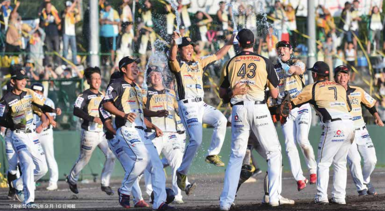
下野新聞令和元年9月16日掲載