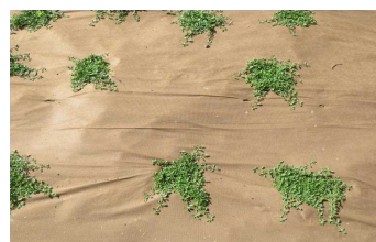
植えた頃の クラピア