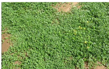
現在の クラピア 広がってます！

昨年中庭に植え、下野新聞でも紹介された「クラピア」が順調に育っています。もうすぐ花も咲くと思います。楽しみです