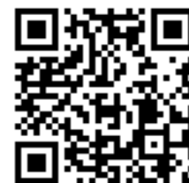
連絡メール2 保護者登録