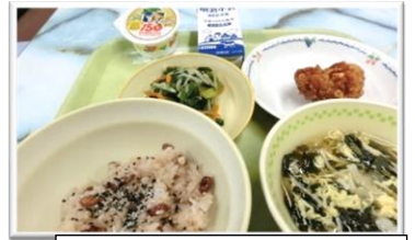
6/15 県誕150周年献立給食 赤飯、唐揚げ、干瓢卵とじ、イチゴゼリー他

今号では、「春季大運動会」「いじめ防止集会」「部活動壮行会」「伝統ふれあい教室」「定期テストに向けた家庭学習状況」「おやじの会」等、地域、保護者の方々を始め皆様に支えられ、小山中プライドで主体的に「前進・〈新〉（生徒会スローガン）」する本校生徒の様子をご紹介します。「元気」を支える美味しい給食 →