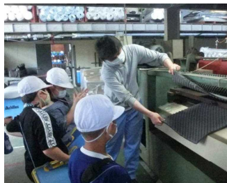
〈株式会社シンデン〉