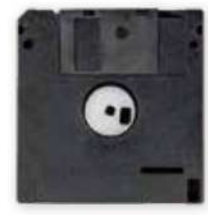
フロッピーディスク

— その記憶、どう残す? — How do you preserve the memory?