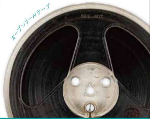
オープンリールテープ