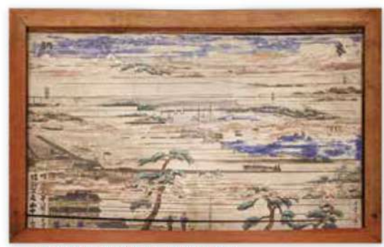
東北線工事絵馬(安房神社蔵)