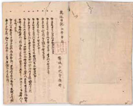
萬延日記(吉光寺日記)