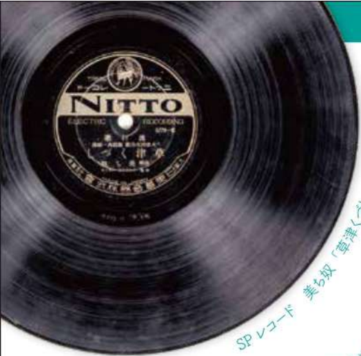
SPレコード 美ら歌「草津くづし」