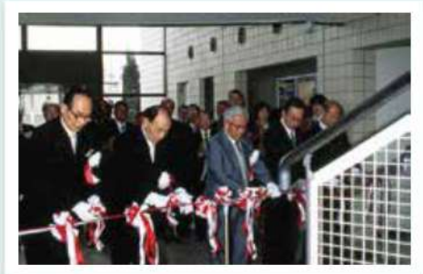
開館記念式典の様子

昭和58年(1983)3月13日、生活様式の変化によって失われつつある郷土の資料を守り、小山市の歴史と文化を後世へ伝えるため、本市に博物館が誕生しました。そして今年、おかげさまで当館は開館40周年を迎えることができました。