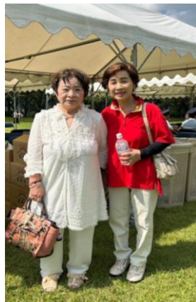
【県女防木沢会長と椎名会長】