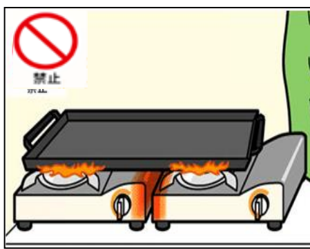
2台以上並べて使用しない