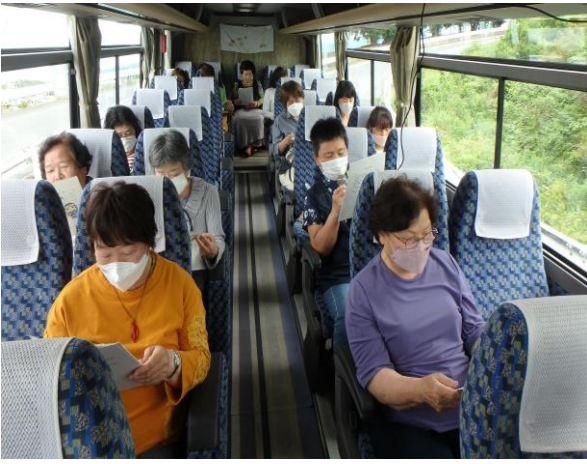
【車内での総会の様子】