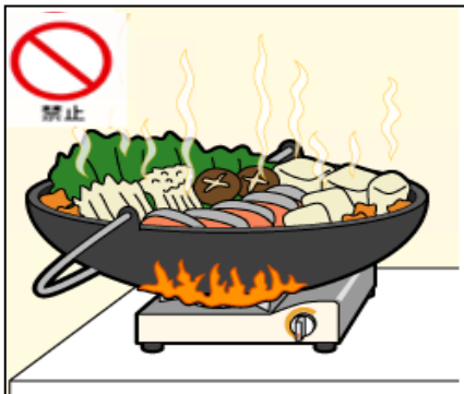
コンロを覆うような大きな調理器具は使用しない