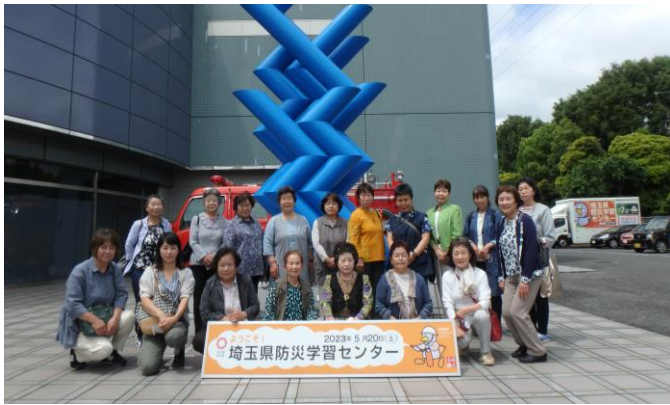
【小山市女性防火クラブ連合会の皆様】