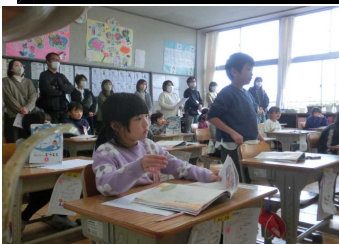
《1年:ともだちのこと》