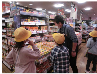
〈スーパーマーケット〉

パトカーに乗せてもらったり、いろいろな種類の消防自動車を見せてもらったりしました。スーパーでは、バックヤードに入らせてもらいました。