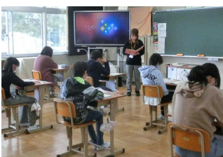
《6年:自分が目指すところまで》

図書委員や中央図書館で講座を受けて「子ども司書」に認定された児童が、読み聞かせを行いました。