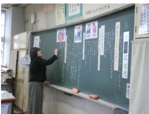
《4年:友達と信頼し合う》