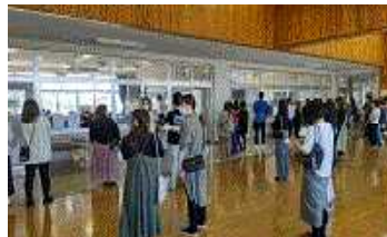
【参観する保護者】 【2年学活の授業】

19日に行われた授業参観には、190名を超える保護者の皆様にご来校いただきまして、改めて学校教育に対する関心の高さを感じました。(生徒数236名)学活や教科の授業など、いきいきと学習するお子様達の姿をご覧いただけたと思います。