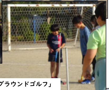
‘グラウンドゴルフ’