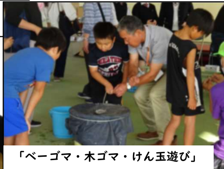
‘ベーゴマ・木ゴマ・けん玉遊び’