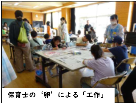
保育士の‘卵’による‘工作’

11月3日は、午前中が城南祭として子どもたちの作品展示や音楽鑑賞会がありました。その日の午後、初めての試みとして「城南の“WA”フェス」を実施しました。子どもたちは自由参加で、ブースごとに分かれて様々な体験活動を楽しみました。写真の7つのブースと、パナソニックホームズによる「SDGs体験」を加えた合計8種類の体験活動があり、子どもたちは満面の笑顔で体験活動を楽しんでいました。