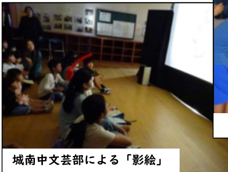
城南中文芸部による‘影絵’