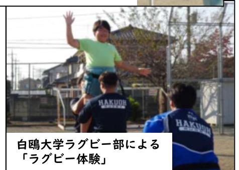
白鷺大学ラグビー部による ‘ラグビー体験’