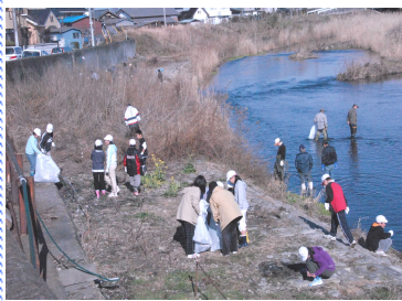
— 巴波川清掃の5年生とボランティアさん —

中小のビオトープにほたるを舞わせ、中地区に「ほたるを観る会」を定着させた本会は、会の究極のねらいである巴波川にほたるが舞うことを願ひながら、数年前から巴波川へのカワニナの放流を実施しています。