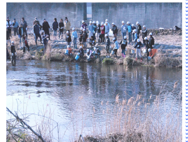
— 期待を込めてカワニナ放流 —