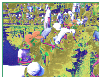
— 市長さんも一緒に田植え —

このように、ほたるの会のボランティアの皆さんは、学校の様々な活動に協力を惜しみません。