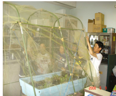
=室内に設けたミニピオトープ=

小さなピオトープですが、僕たちはどんな環境にするのかなど何度も話し合い工夫しました。今は、ほたるが飛ぶ日を心待ちにしています。