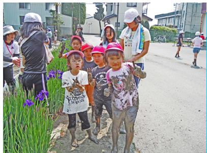
—泥んこは良く働いた証しです。—

稲は現在、日差しを受けて緑豊かに育っています。秋に収穫するお米は「えのき祭」で児童のカレーライスボランティアの皆さんに振舞