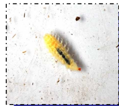
— 脱皮した幼虫 —

4月に最後の世話をしていたら白い幼虫が居ました。突然変異で白い虫になるのかなと思いました。また笑われました。脱皮したては白いんだそうです。すぐに黒くなっちゃうということでした。