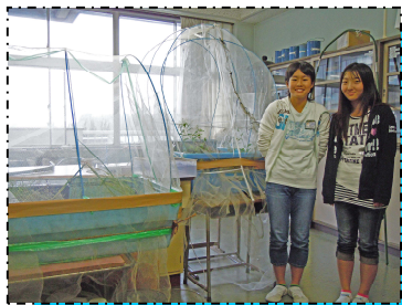
一網をかけたミニビオトープ

私達は初めて水辺のビオトープに、ホタルはどんな環境がすみやすいかなど調べるために巴波川の環境に似たほたるのビオトープを作りました。ホタルの天敵の鯉をつかまえたのでほたるが飛んでくれるとうれしいです。