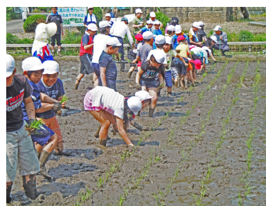
—教わりながら植えました。—

えのき祭では収かくした米でカレーライスを作るので田植えを協力してくださった方などに食べてもらいたいです。