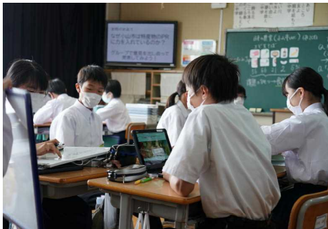
学びあいを大切に