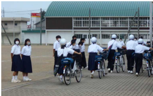
スマイルプロジェクト