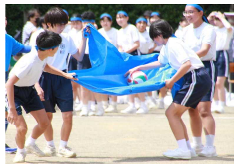
フライシートリレー（3年生）