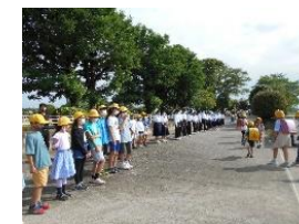
小中合同あいさつ運動