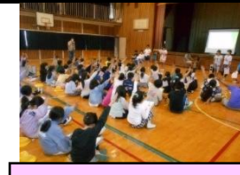
小小交流;遊水地学習