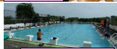
小小交流;水泳発表会