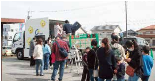
ほっしー★OYAMA号による太陽観測

火起こし体験や科学ショーなど様々なイベントが盛りだくさんの1日。博物館をもっと知って、楽しく学びましょう!博物館友の会による「友の会作品展」も同時開催しています。