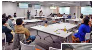
これまでのワークショップの様子