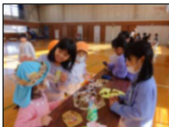
どんぐりのかんむり