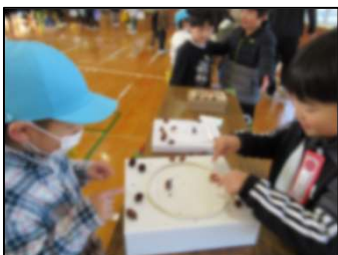
どんぐり・松ぼっくり 相撲

こぐま保育園の4才・5才児32名を招待し、生活科で作ったおもちゃと一緒に遊びました。どんぐりや松ぼっくりなどを使ってこまやけん玉、パラシュート、迷路を作り、園児のみなさんに遊んでもらいました。普段の学校生活では一番下の学年ですが、年下の子たちを前にして、積極的に話しかけたり遊び方を教えたり、お兄さんお姉さんとして活動することができました。