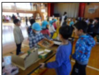
どんぐり・小枝の 迷路