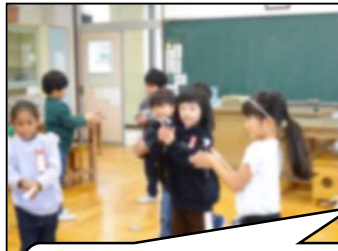
「紙トンボ、上手に飛ばせるかな？」 コツを教わりながら、工夫して飛ばしました。