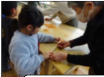
ゴムでっぼうの打ち方を教わり、 ゴムを的に当てました。

生活科の学習では、割りばし鉄砲や紙トンボなどで昔遊び体験を行いました。3名のボランティアの方にお越しいただき、遊び方を教わりました。おもちゃは全てボランティアの方に作っていただいたものです。子どもたちは、目を輝かせて的当てをしたり、友達と紙とんぼを高く飛ばし合ったりして昔遊びの楽しさを体験し、充実した時間となりました。持ち帰り用のおもちゃもいただきました。