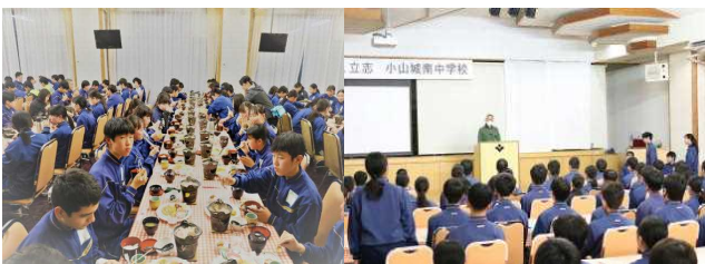
【夕食：いっぱい食べて活かに】