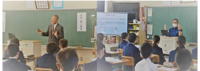
【(株)古口工業 代表取締役】