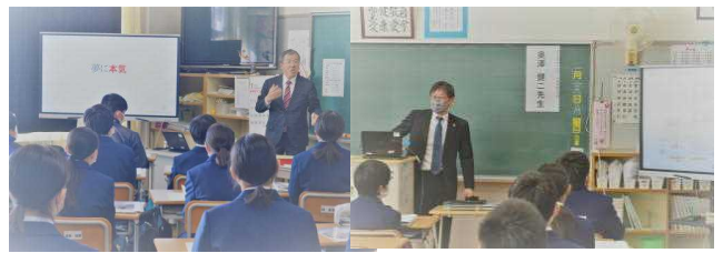
【日本フラスカ 代表取締役】