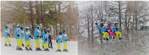
【班ごとにレッスンスタート】