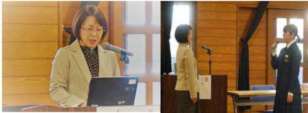
【青木栄養教諭 講話】 【給食委員長 感謝の言葉】

1月15日から1週間「給食週間」でした。本校の給食は、大谷中学校内にある大谷学校共同調理場で調理され、給食専用のトラックで、毎日運んでいます。17日は給食委員会の企画運営による「給食集会」を実施しました。