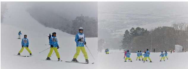
【滑れるようになりました】