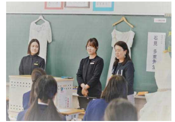
【(株)アリオデザイン&ST&S 社長】

仕事の内容やその職業を選んだ理由、働くことの意義や喜び、やりがいなどの話を聴くことができました。今後のアドバイスも頂きました。