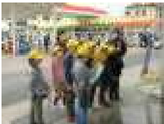
エネオス間々田東店