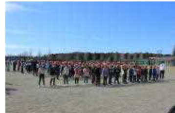
サプライズ「Y E L L」

また、6年生へ、1年生から分担してつくって5年生が完成させたブックカバーとしおりをプレゼントしました。