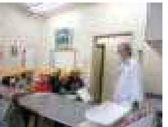
ブレイス動物の病院