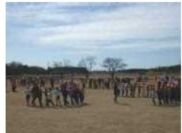
全校じゃんけん列車

そこで、全校児童で「じゃんけん列車」と「ケイドロ」をして遊び楽しい時間を過ごしました。最後に、サプライズで「Y E L L」を歌い6年生に送りました。