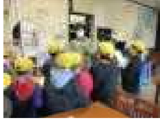
らーめん餃子専門ー（HAJIME）