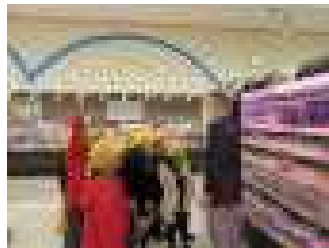
とりせん美しが丘店