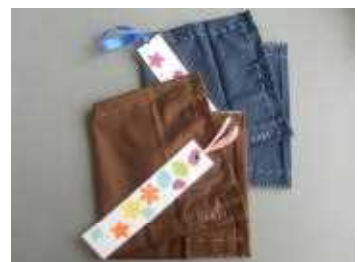
ブックカバーとしおり