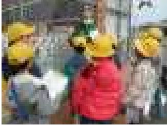
セブンイレブン西黒田店

3月5日（火）に町探検に出かけました。地域にある事業所の普段見られない場所の見学や製品の作り方を教えていただきました。貴重な体験ができました。