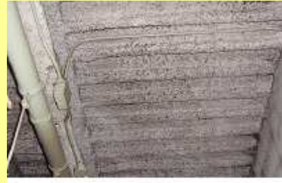
（柱・梁・天井などに吹付けられたアスベストの例）