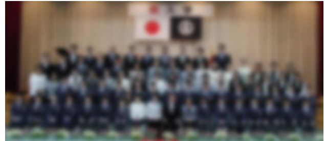
入学式後の記念写真