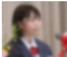
新入生代表挨拶→ (N さん)