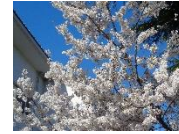
美田中の桜も満開です

昨年度に引き続きまして校長を務めます。保護者の皆様、地域の皆様には昨年度も温かなご支援をいただきました。誠にありがとうございました。美田中学校の生徒達の安心安全を第一に考え、教職員一同、誠心誠意、生徒達と向き合っ参ります。今年度もご理解ご協力をどうぞ宜しくお願いいたします。