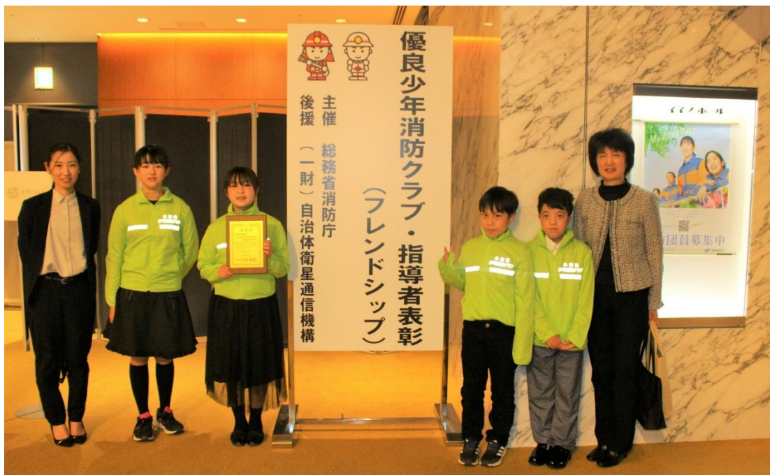
小山市立下生井小学校 ES 消防クラブが受賞した令和5年度優良少年消防クラブ・指導者表彰（総務大臣賞）