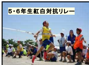
5・6年生紅白対抗リレー