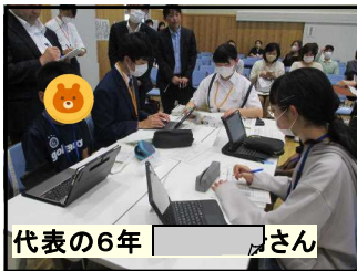
代表の6年 [ ] さん

いじめの構造等を理解し、いじめを自分事として考え、「いじめは絶対にしてはいけない」という心情を育むため、「いじめ防止強調月間」に様々な取組を行いました。朝の