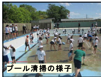
プール清掃の様子

6月5日（水）に、「プール開き」を行いました。放送を使って各教室にて実施しました。校長の話で、3つの約束を話しました。①「感謝」みんなの協力でプールで泳げる