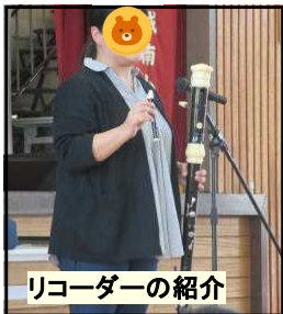
リコーダーの紹介