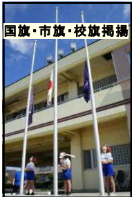
国旗・市旗・校旗掲揚