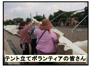
テント立てボランティアの皆さん