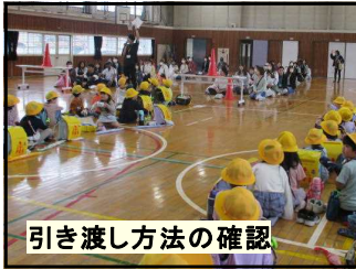
引き渡し方法の確認