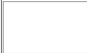
「きりもみ法」でチャレンジ中!

5月23日(木)、6年生が「歴史学習」のため、小山市立博物館に出かけました。そして館内の常設展と館に隣接する「乙女不動原瓦窯跡」の見学、そして「火おこし体験」を行いました。