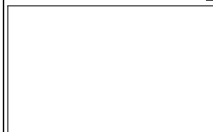
キリンへの餌やりに夢中です!

5月21日(火)、2年生が遠足で「宇都宮動物園」に出かけました。午前中は、動物園で学級毎に行動していました。動物に餌をやるときは、歓声(悲鳴?)が響いていましたが、担任の先生が集合の声をかけると、子供たち同士で声を掛け合って集合していました。自分のことよりみんなのことを考えて行動していた2年生。楽しい思い出とともに、できることもたくさん増やした一日でした。