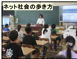
ネット社会の歩き方