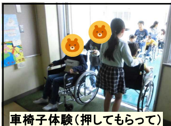
車椅子体験（押してもらって）