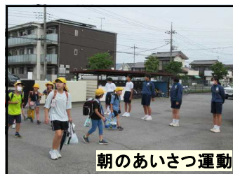
朝のあいさつ運動