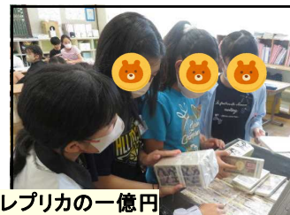
レプリカの一億円

とちぎネット利用アドバイザーにお越しいただき、6年生と保護者を対象に、ネット社会を楽しく安全に歩いていくための講習会を実施しました。また、税の意義や役割を正しく理解していくために、小山市資産税課職員の方に税の使い道などの説明をしていただきました。