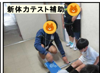
新体カテスト補助