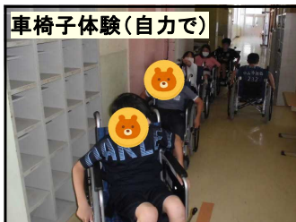
車椅子体験（自力で）