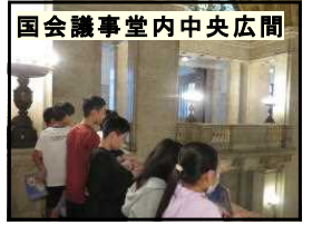
国会議事堂内中央広間