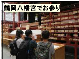
鶴岡八幡宮でお参り