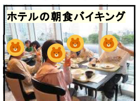
ホテルの朝食バイキング

2日目は、ホテルでの朝食から、スタートしました。小山城南小だけの貸し切りだったので、ゆっくりといただくことができました。その後、国会議事堂に向かいました。車窓から見える横浜や東京の名所をガイドさんが案内してくれました。今回は、衆議院議場を見学しました。赤じゅうたんを歩きながら、テレビや教科書の写真で見たことのある国会議事堂の中を真剣に見学している様子が印象的でした。最後の見学地は、東京タワーです。メインデッキから班ごとに見学しました。メインデッキには、床が一部透明になっているところがありました。そこから、恐る恐る道路を走る車や人を見下ろしている姿も見られました。公衆のマナーをしっかりと守り、友情を深められた思い出に残る修学旅行となりました。