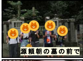
源頼朝の墓の前で