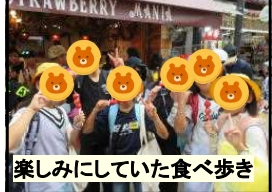
楽しみにしていた食べ歩き