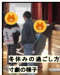
冬休みの過ごし方 寸劇の様子

12月25日（水）に、全校児童が一堂に会して、体育館で終業式を行いました。校長からは、2学期に実施した様々な行事や始業式に話した3つのことについて、意欲的に取り組んでいた児童の様子を伝えました。その後、2・4・6年代表児童から、2学期に頑張ったことなどの発表がありました。目標をもって生活していたことが伝わりました。皆、しっかりとした態度で堂々と発表していました。家族との時間を大切に、有意義な冬休みを過ごしてほしいと思います。