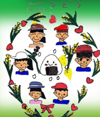
お米の生産者 小山田立中小学校の田んぼ