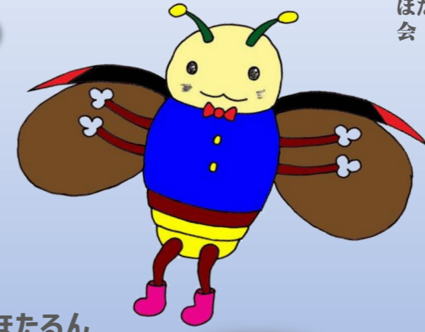
ほたるん 中小イメージキャラクター