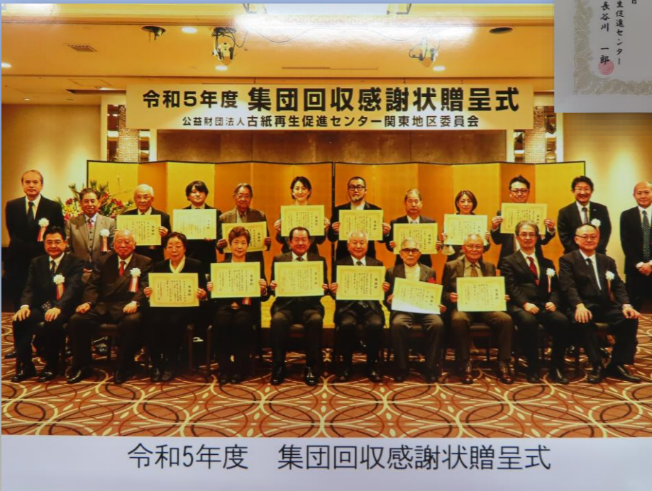
令和5年度 集団回収感謝状贈呈式

公益財団法人古紙再生促進センターでは、古紙の回収活動を継続的に実施している町内会や子供会などの集団回収実施団体に対し、既定の条件を満たした団体を表彰しています。