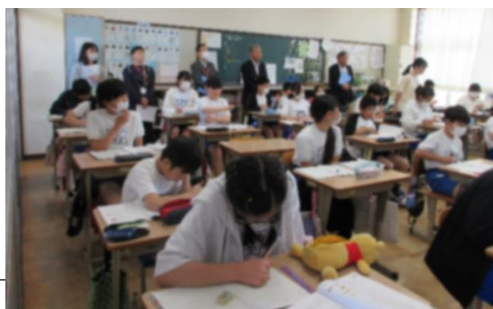
写真：会議前に全クラスの授業を参観

今後も声を掛け合ってボランティアを強化していくこと、学校側のニーズを明らかにしていくことなどが話し合われ、直近の課題である校内の伐採した木の片付けでのご協力の提案もいただきました。活発な意見交換ができ、学校のために・・・という熱い思いがあふれていました。