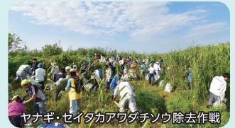
ヤマギ、セイタカアワダチソウ除去作戦