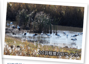
20羽程度のコウノトリ