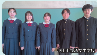
小山市立乙女中学校