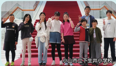
小山市立下生井小学校

●登壇者：小山市立下生井小学校、小山市立乙女中学校、 NPO法人わたらせ未来基金 など