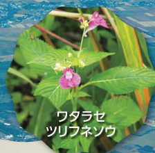
ワタラセ ツリフネソウ