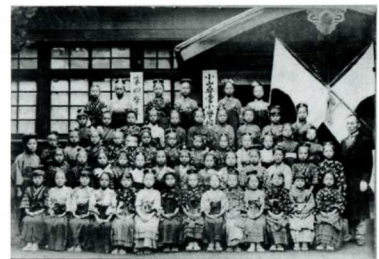
小山尋常小学校集合写真(大正4)